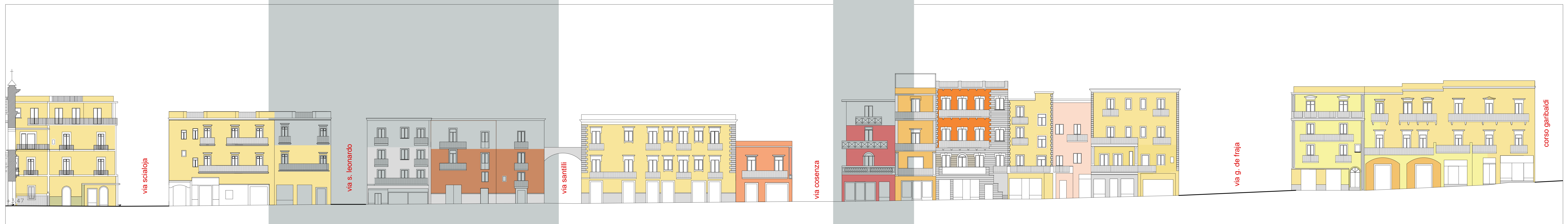
IPOTESI DI RICOMPOSIZIONE Corso della Repubblica - Profilo nord